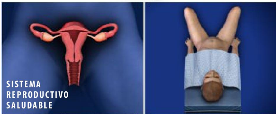
SISTEMA REPRODUCTIVO SALUDABLE