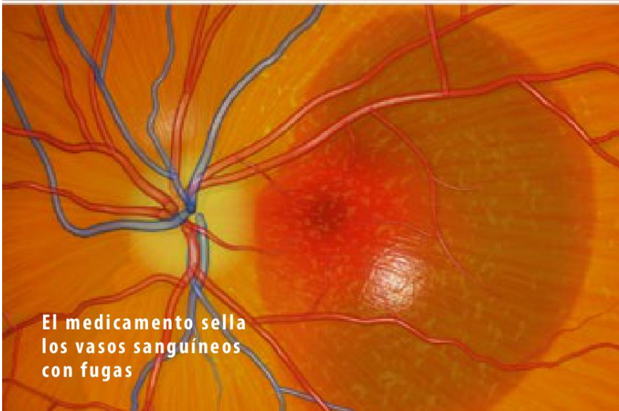
El medicamento sella los vasos sanguíneos con fugas