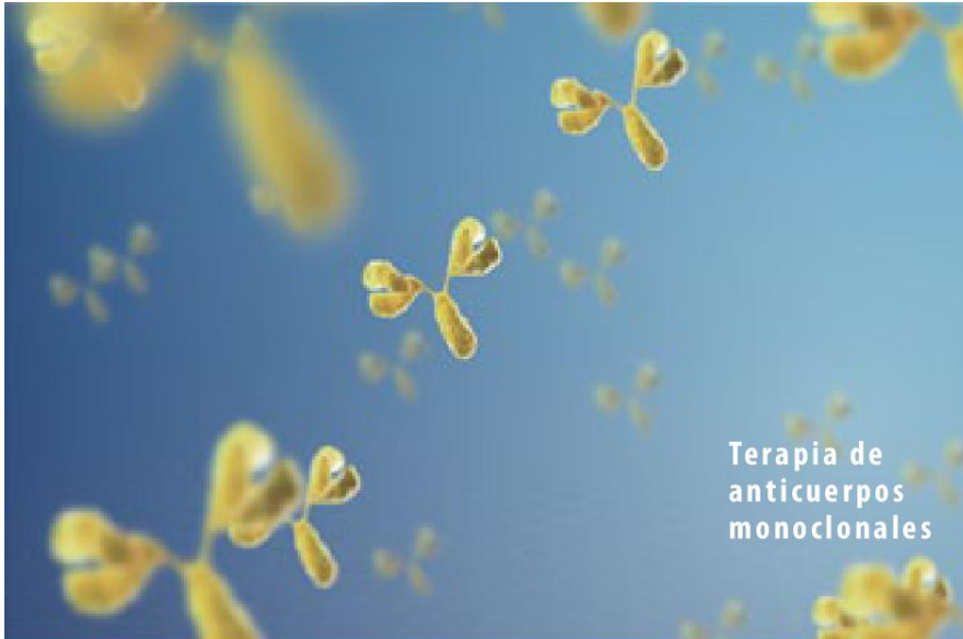
Terapia de anticuerpos monoclonales