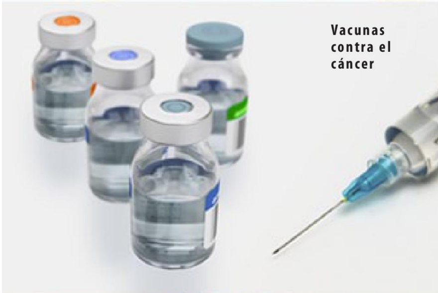
Vacunas contra el cáncer