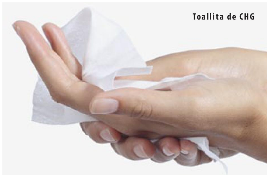
Toallita de CHG

Utilice una toallita por cada área del cuerpo