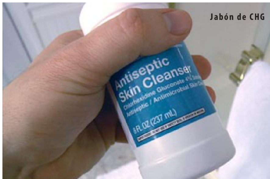
Jabón de CHG