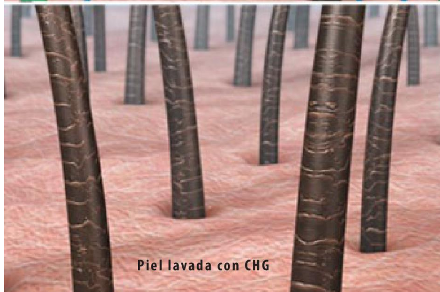
Piel lavada con CHG