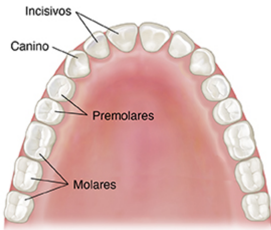
Dientes de adulto